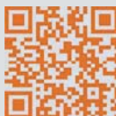
Anwendungsvideo Application Video

Transfer-Control Plus este o combinatie între sistemele testate de Transfer-Control și Transfer-Ring - Control. Instrumentele perfect coordonate permit montarea cu precizie a grefelor osoase, și oferă cele mai bune condiții pentru vindecare sigură și rapidă. Numărul mare de instrumente diferite asigură flexibilitate ridicată în extracții. Transfer-Control Plus include un set largit de instrumente pentru grefarea controlată a inelelor osoase.